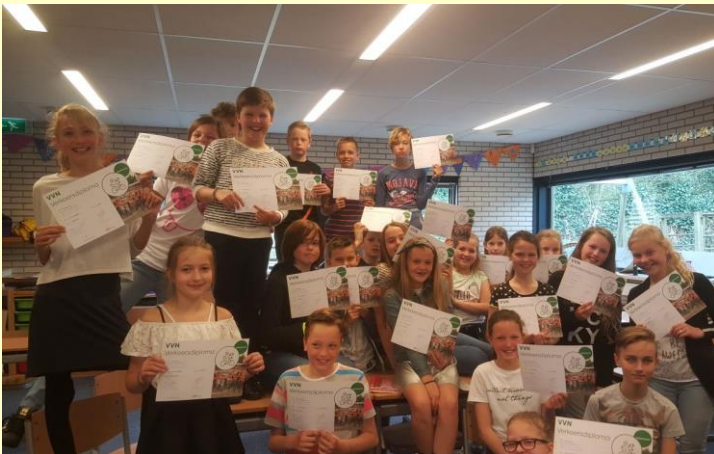
De kinderen van groep 7 met hun diploma