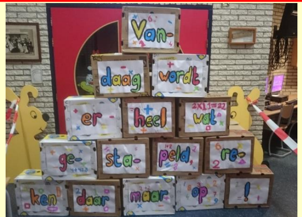
De dozen die bij de inleiding van de Grote Rekendag gebruikt werden.

Al met al weer een interessante, leerzame dag