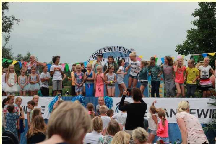
Op deze foto een beeld van het zeer gezellige Pleinfeest 2017. Dit om u alvast in de stemming te brengen voor de tweede editie op 22 juni. Zie verder het artikel hieronder.