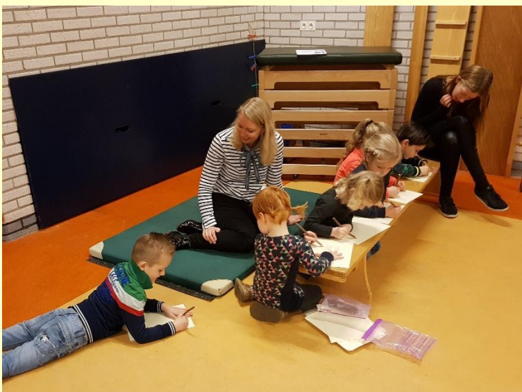
Een van de groepjes tijdens het taalfeest van groep 1.

A.s. vrijdagochtend doen we mee aan de Koningsspelen. Net als voorgaande jaren starten we weer met een lekker ontbijt. De kinderen hoeven dus niet van te voren te eten, dat doen we samen op school in de klas. We stoppen iets later, om 12.00 uur. Iedereen mag zich in het oranje verkleden. We maken er samen een gezellige feestochtend van.