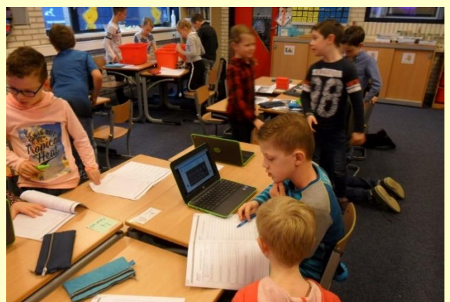
Groep 4 hard aan het werk bij het oplossen van de rekenvraagstukken.