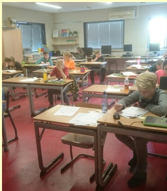
Deze week zijn de CITO eindtoetsen. Ook de leerlingen uit groep 8 van onze school zijn daar intensief mee bezig.

Daarnaast zullen er aan het begin van het volgende schooljaar nog drie studiedagen worden gepland. U krijgt die data zo snel mogelijk van ons.