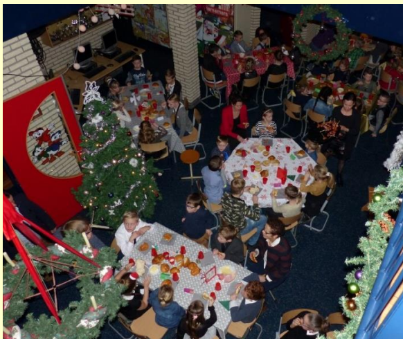
Een beeld van de kerstmaaltijd van vorig jaar. Heel gezellig allemaal samen aan tafel.

Donderdagavond is de jaarlijkse gezamenlijke kerstviering op school. Om 17.30 uur zijn alle kinderen welkom in hun groep voor de gezamenlijke Kerstmaaltijd. De kinderen van groep 1 t/m 8 gaan in een gezellige mix aan 32 verschillende tafels heerlijk genieten van de kerstmaaltijd . De ouderraad zal alles versieren en verzorgen voor de kinderen. Het wordt vast weer heel sfeervol. Om 19.00 uur gaan we met alle kinderen naar de kerk voor de kerstviering . Alle ouders zijn daarbij ook uitgenodigd. Tijdens de viering zal er een collecte zijn. We vertellen het kerstverhaal en zingen samen veel kerstliedjes die we op school al hebben geoefend. Als de viering is afgelopen kunnen de kinderen met hun ouders terug naar het schoolplein gaan voor een afsluitend "samenzijn" . Er zal voor iedereen wat te drinken zijn; warm en koud. Ook is er nog iets lekkers bij te eten. Mmmm! We willen als team nu alvast de O.R. en de andere hulpouders heel hartelijk danken voor het vele werk bij deze activiteit van donderdag. Het wordt vast een prachtige afsluiting van 2018.