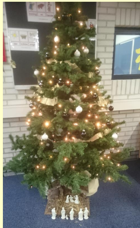
Naast de centrale hal zijn ook de klassen versierd. In alle groepen staat een hele mooie kerstboom met stal.

Daarnaast zijn we nog op zoek naar twee klaarovers voor de donderdag om 11.45 uur . En voor de vrijdag tussen de middag. Of om 11.45 uur of om 12.45 uur . Wie helpt ons uit de brand en neemt deze beurt op zich? Nu moet er iemand twee keer staan.