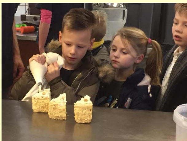
De kinderen van groep 3 mochten ook zelf een taartje versieren.