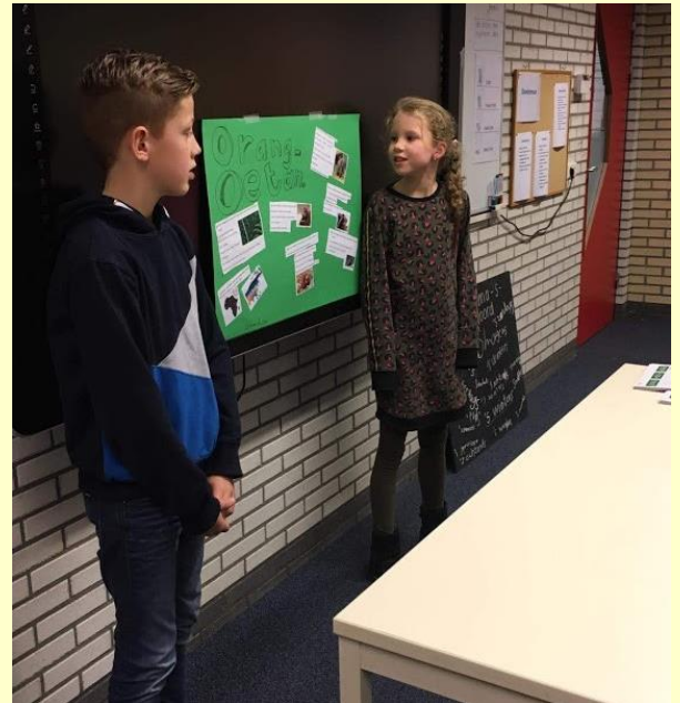
Ook in groep 5 werden er mooie presentaties gegeven.

Vol trots presenteerden de leerlingen van groep 5 t/m 8 maandagavond 14 januari al hun gemaakte werk. Er is de afgelopen maanden gewerkt aan opdrachten binnen de thema's 'Ik, Jij, Wij', 'Sport & Ontspanning' en 'Water, Aarde, Lucht en Vuur'. De hal hing vol met de gemaakte muurkranten en in alle klassen werd voor een groot publiek gepresenteerd. Leerlingen van groep 8 bakten, met behulp van ouders, stapels pannenkoeken. Wij willen alle kinderen bedanken voor hun enorme inzet en de mooie, goed voorbereide presentaties. Best spannend om voor zoveel ouders je verhaal te vertellen, maar jullie deden het fantastisch. Ouders, opa's en oma's en alle andere aanwezigen, bedankt dat jullie er met zoveel waren om al dit moois te bekijken en beluisteren!