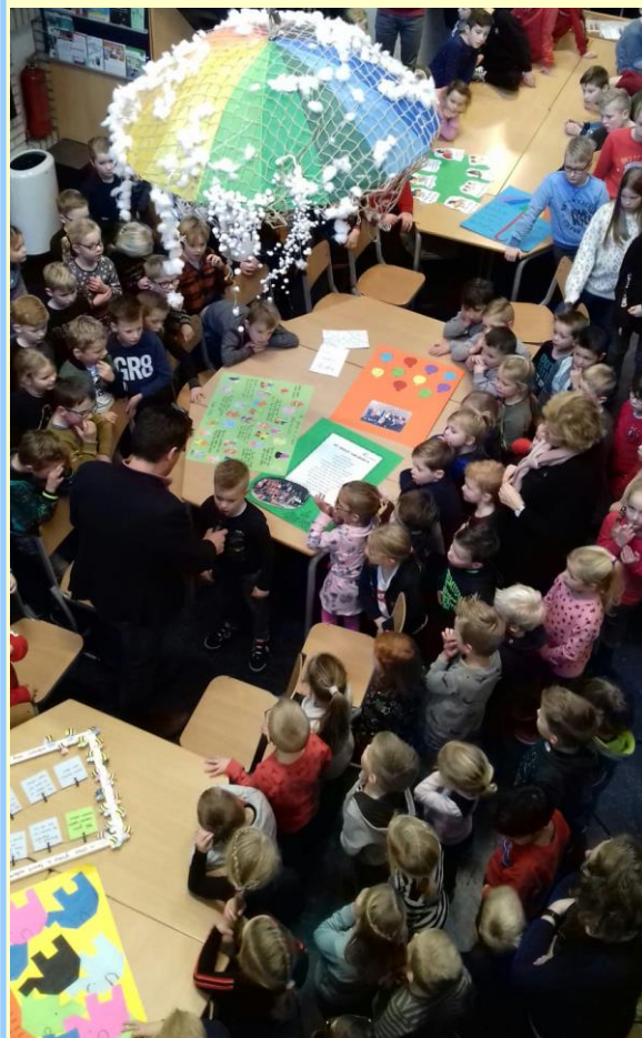
Kinderen uit de verschillende groepen vertelden aan elkaar wat hun tops waren en wat er nog beter kan. De tips.

Het komende half jaar gaan we vooral aan de tips werken en proberen we de tops even goed te houden. De bijeenkomst in de centrale hal werd afgesloten met het zingen van ons schoollied. Er werd uit volle borst gezongen en daarna ging iedereen weer terug naar de eigen groep.