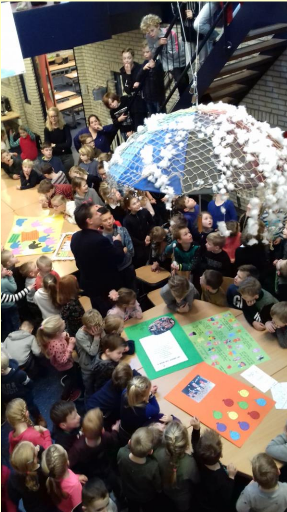
Nog een beeld van de afsluiting van de zilverenweken.