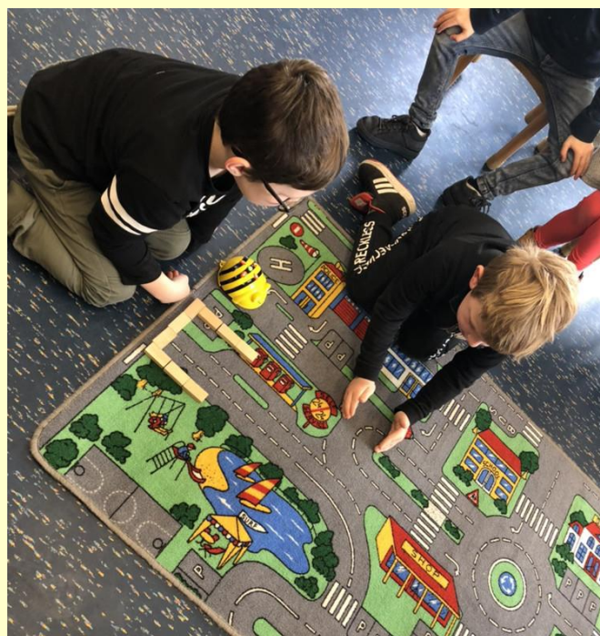
In groep 2 is gewerkt met Beebots.

De laatste oud papieractie heeft 1200 kg opgeleverd. Bedankt voor het aanleveren. Aan het eind van de maand staat de container er weer een paar dagen.