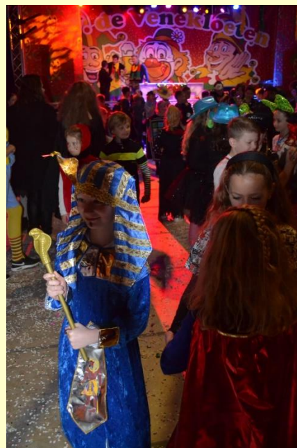
Het was een gezellig boel maandagmiddag in De Baron.

Het is de bedoeling dat alle kinderen van groep 1 deze dinsdagmiddag ook naar school toe gaan.