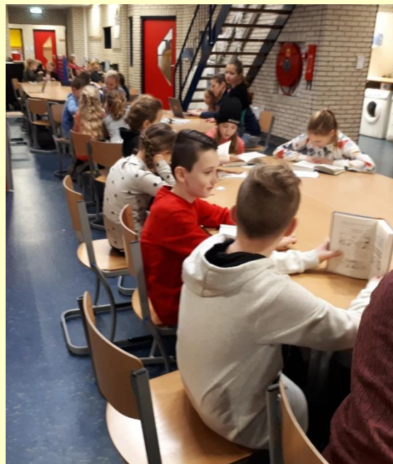
Kinderen uit de verschillende groepen zijn aan het werk met het lezen met BOUW.

Op deze manier proberen we leesproblemen bij risicoleerlingen in groep 2 t/m 4 te voorkomen.