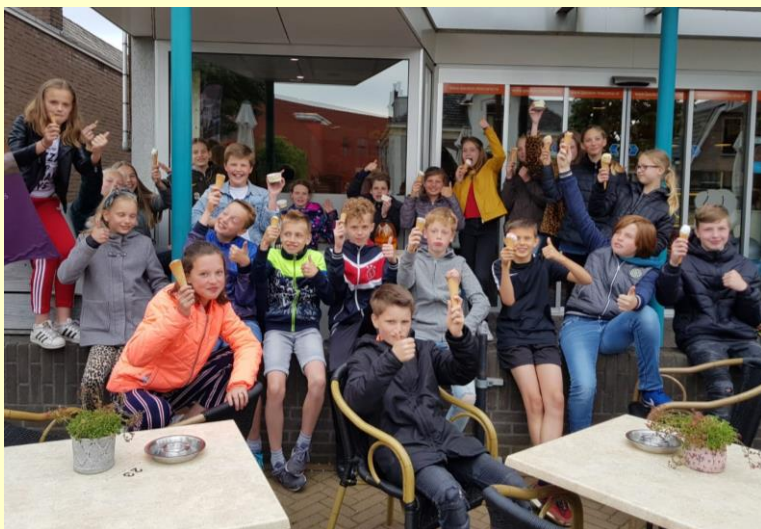
Het jongensteam is bij de regiofinale voetbal 3 e geworden en de meisjes werden vierde. Mooie prestatie gehaald met sportief spel en hard werken. Dat vonden we samen met de goede CITO eindtoetscore een ijsje waard. Hier genieten ze van hun traktatie.