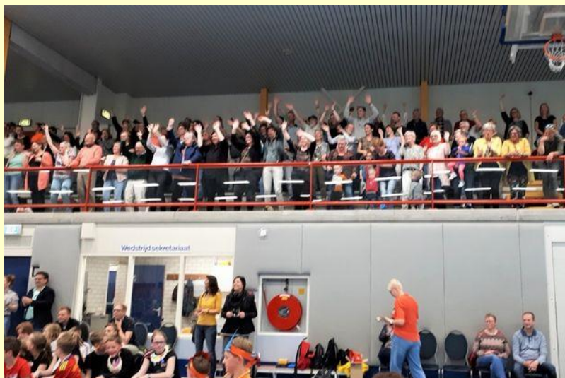
Een tribune vol ouders en andere belangstellenden die ook actief meededen bij de Drum4fun voorstelling.

Bedankt voor het aanleveren. Aan het eind van de maand staat de container er weer een paar dagen.