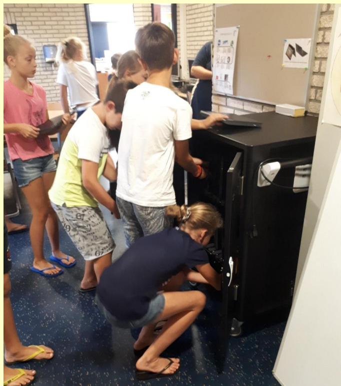
Vlak voor de vakantie zijn er 32 nieuwe tablets aangeschaft. De Chromebooks staan nu in prachtige kasten bij de verschillende groepen.