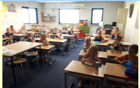
Het leslokaal van groep 4 helemaal vernieuwd.

We hopen dit jaar op allemaal gezonde traktaties.