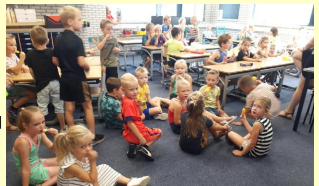
Veel kinderen die in de vakantie jarig waren trakteerden nog in hun klas. En vanwege het warme weer was dat vaak een heerlijk ijsje.