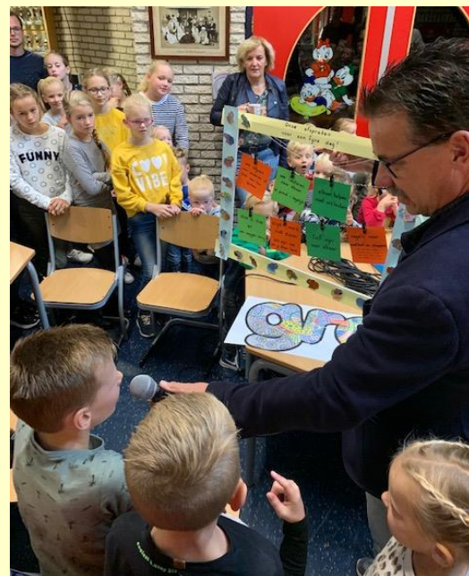
Iedere groep kon precies vertellen wat de belangrijkste afspraken waren voor hun eigen groep.

De foto's van dit samenzijn kunt u zien op de website achter deze link: https://myalbum.com/album/7fLds8mcPcaS