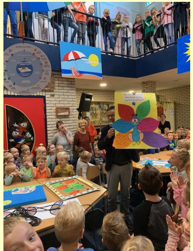
De presentatie van groep 8 met hun pauw!