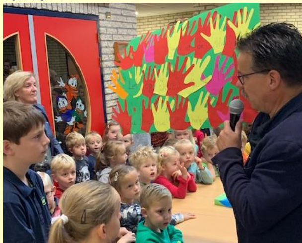
De presentatie van groep 7 tijdens de afsluiting van de Gouden Weken.

A.s. vrijdag zijn alle kinderen vrij van school. Wilt u daar rekening mee houden?