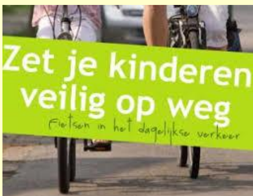
Het startpunt is een veilige fiets.

Ieder jaar komen er mensen van stichting De Stuw om alle fietsen van de kinderen uit de groepen 3 t/m 8 te controleren. Dinsdag 29 oktober worden alle fietsen gecontroleerd in de ochtend. Het is de dag van de gym dus 6 t/m 8 heeft de fiets al bij zich. Groep 3 t/m 5 mag dan ook de fiets meenemen. Alle kinderen krijgen een kaartje over de keuring van hun fiets. Op het kaartje staat wat er eventueel niet goed of dat de fiets helemaal top is. Het doel van de actie is dat alle kinderen veilig de herfst- en winterperiode ingaan.