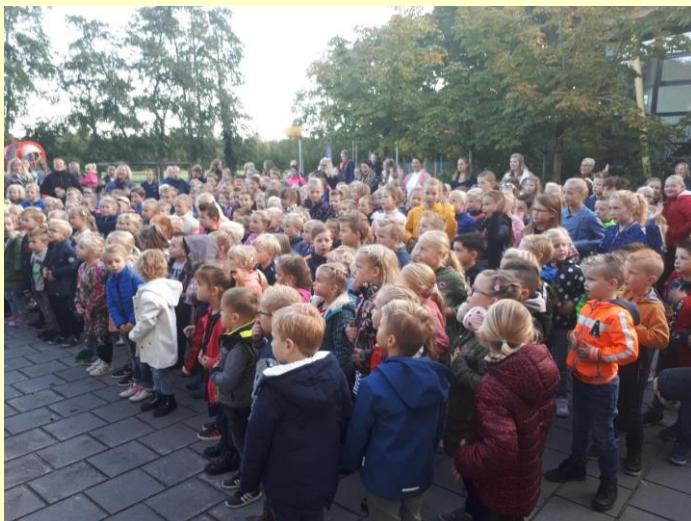
De opening van de kinderboekenweek. Via de link kom je bij nog wat foto's en twee mooie filmpjes van de openingsdans:

Op woensdag 2 oktober 2019 hebben we met de hele school de Kinderboekenweek geopend. We hebben samen gedanst op het nummer van kinderen voor kinderen: Reis mee!. Dit jaar is het thema van de Kinderboekenweek dan ook reizen. In de groepen wordt druk gewerkt aan een kleurplaat, tekening of limerick die past bij het thema. Daarnaast zijn de groepen druk aan het oefenen voor het optreden tijdens de gouden microfoon. Dit is de afsluiting van de Kinderboekenweek en vindt plaats op woensdag 16 oktober. Op woensdag 9 oktober organiseren we een boekenmarkt, we hopen op een goede handel! (zie ook blad 5)