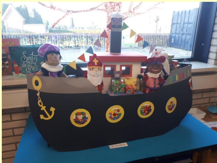
Ook in groep 1B staat een prachtige sinterklaasversiering. Hier komt hij nog wel aan met zijn stoomboot.

We hebben ons met de Langewieke opgegeven voor deze actie die scholen en verenigingen steunt. We hebben hier ruim € 400 aan verdiend. Dit bedrag wordt, zoals eerder gezegd, gebruikt voor de aanschaf van een extra tablet.