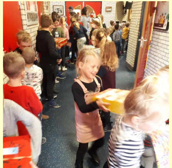
Door een lange slang van kinderen werden de dozen doorgegeven naar de uitgang.

Twee weken geleden is deze actie afgesloten. Er was geld ingezameld voor 84 dozen. Alle groepen hebben hun dozen mooi versierd. De meesters en juffen hebben er met de kinderen van groep 8 voor gezorgd dat elke doos de juiste vulling kreeg. Hier en daar moesten we er nog was spulletjes extra gekocht worden. Op de foto hiernaast is te zien dat alle dozen door een lange rij met kinderen worden doorgegeven naar de auto. Enkele ouders van de Ouderraad hebben daarna de dozen naar het verzamelpunt van deze actie gebracht. Iedereen die op wat voor manier dan ook heeft geholpen. Hartelijk dank.