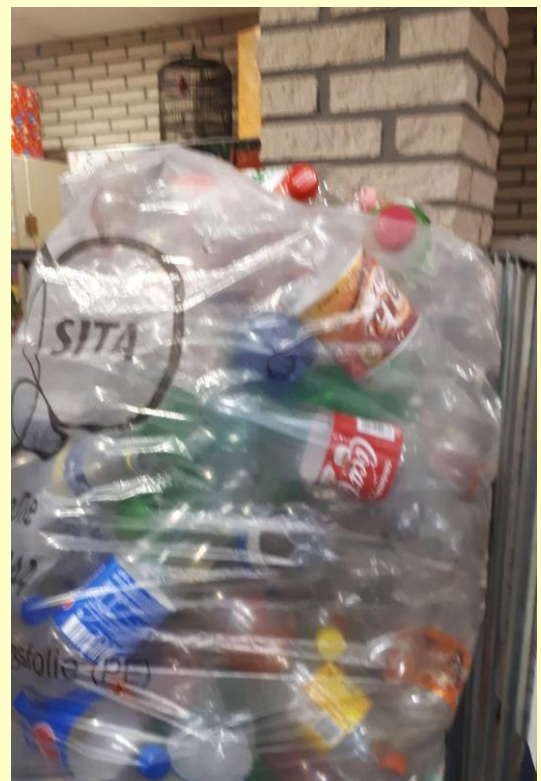
De eerste mega zak was helemaal gevuld en is dinsdag omgevuild.

De stichting Bag 2 school heeft alle oude kleding die was ingezameld weer opgehaald. Dit keer ruim 400 kg wat het mooie bedrag van € 122,40 heeft opgeleverd. Blijft u ons alle oude kleding brengen? Mooi extraatje zo. Bedankt voor uw medewerking.