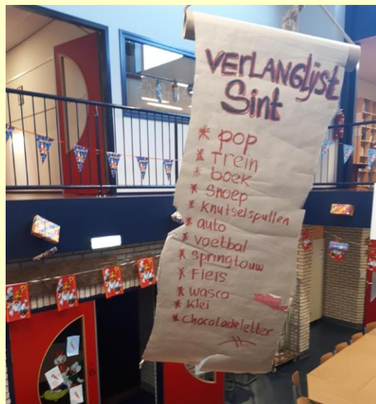
De mega grote verlanglijst zoals die t/m vandaag in de centrale hangt.

Donderdagavond 19 december is de jaarlijkse gezamenlijke kerstviering op school. Om 17.30 uur zijn alle kinderen welkom in hun groep voor de gezamenlijke Kerstmaaltijd. Om 10 voor half 6 kunnen de kinderen naar binnen. De kinderen van groep 1 t/m 8 gaan in een gezellige mix aan 34 verschillende tafels heerlijk genieten van de kerstmaaltijd . De ouderraad zal alles versieren en verzorgen voor de kinderen. Het wordt vast weer heel sfeervol. Om 19.00 uur gaan we met alle kinderen naar de kerk voor de kerstviering . Alle ouders zijn daarbij ook uitgenodigd. Tijdens de viering zal er een collecte zijn. We vertellen het kerstverhaal en zingen samen veel kerstliedjes die we op school al hebben geoefend. Als de viering is afgelopen kunnen de kinderen met hun ouders terug naar het schoolplein gaan voor een afsluitend "samenzijn" . Er zal voor iedereen wat te drinken zijn; warm en koud. Ook is er nog iets lekkers bij te eten. Mmmm! Vrijdagochtend 20 december vieren alle groepen het kerstfeest in hun eigen groep. Vrijdagmiddag zijn dan alle kinderen vrij en begint de Kerstvakantie.