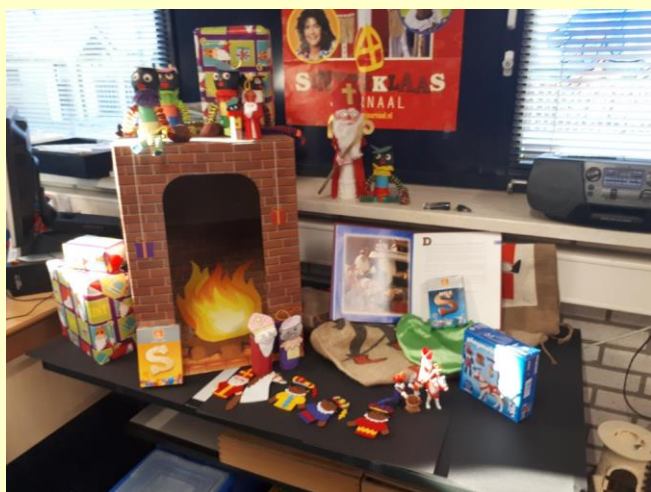
Ook in groep 1 is het erg gezellig in de sinterklaastijd.

Voor een aantal dagen zal het parkeren nog moeilijker zijn. Op woensdag 11 dec. t/m zaterdag 14 dec. zal er op het kerkplein een feesttent staan voor de kerstmarkt van St. Vitus. Probeer deze dagen dus aub op de fiets te komen of parkeren naast De Zeven Linden, het is dan iets verder lopen. Het zorgt voor wat extra ongemak, maar het is helaas niet anders deze dagen. In ieder geval alvast bedankt voor uw medewerking.