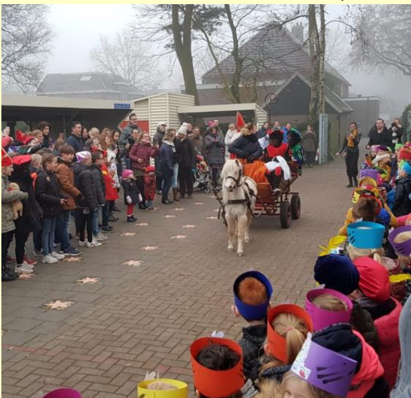
Sinterklaas kwam vanochtend aan op een karretje met pony Ozolangzaam ervoor..

Op vrijdagmiddag 20 december zijn de groepen 5 t/m 8 ook vrij van school. Dus de kerstvakantie begint voor alle kinderen om 11.45 uur.