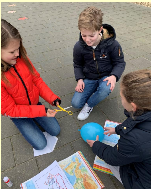
In groep 6 zijn de kinderen deze weken druk aan de slag met lessen vanuit het thema "Wie is de mol". Ze vinden het erg leuk om te doen.