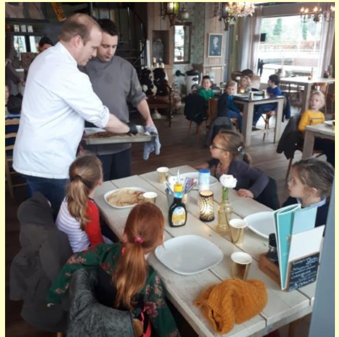
Hier krijgen de kinderen van groep 2 hun lekkere pannenkoek..

Bij groep 1 en 2 werken de kinderen op dit moment met het thema Restaurant. Gisteren en vorige week maandag zijn alle kinderen van de groepen 1 en 2 naar Het Dorp geweest. In een echt restaurant werd er door iedereen een heerlijke pannenkoek gegeten. Ook mochten de kinderen nog even in de keuken kijken. Het was erg geslaagd! De vaders van Jim en Lily willen we hartelijk bedanken!