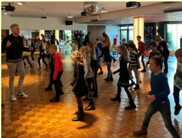
In groep 5 zijn de danslessen weer begonnen!

Alle activiteiten kunt u iedere dag actueel bekijken via onze website www.delangewieke.nl Rechts bovenaan: " Agenda ".