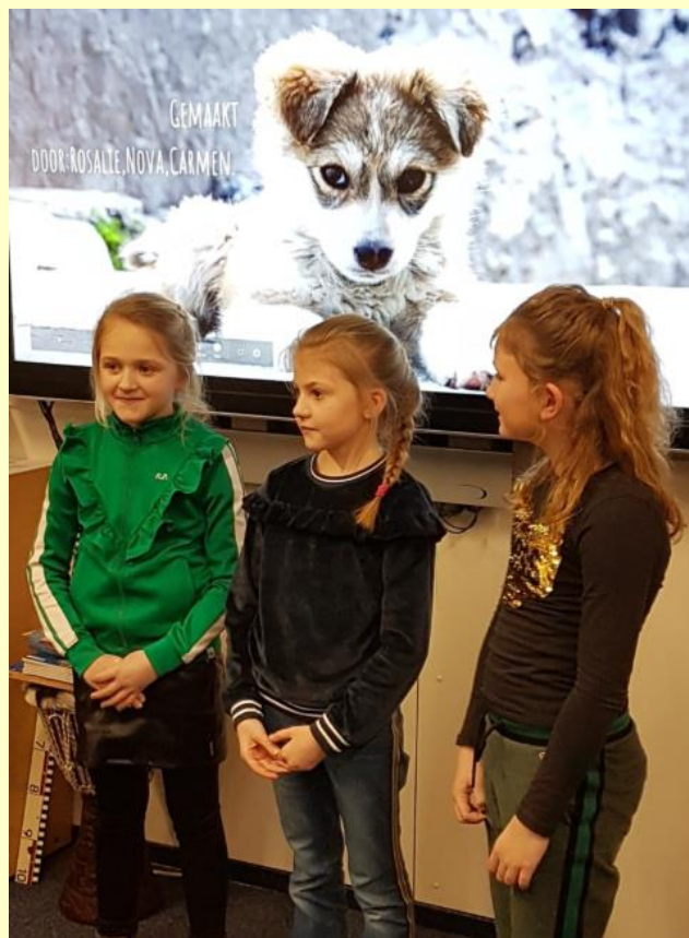
Ook in groep 5 werden er mooie presentaties gegeven.

Ouders, opa's en oma's en alle andere aanwezigen, bedankt dat jullie er met zoveel waren om al dit moois te bekijken en beluisteren!