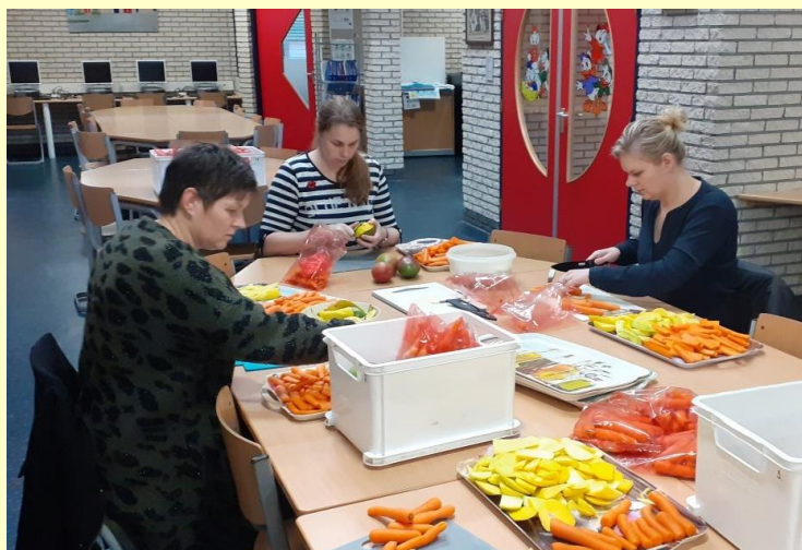
De fruitsnij moeders druk aan de slag!

In december 2019 zijn er maar liefst 130 zakken oliebollen besteld bij de ouderraad. Onze dank voor uw bestellingen. Hierdoor is er een mooie opbrengst van € 260,- ontstaan.