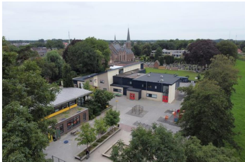
Ons mooie schoolterrein vanuit de lucht.