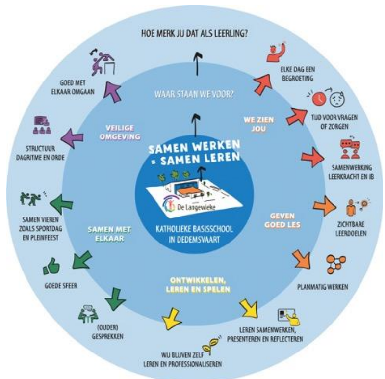
Infographic visie KBS De Langewieke

Onze visie is weergegeven in een infographic die in alle lokalen en in de hallen hangt en een mooie plek heeft op het schoolplein.