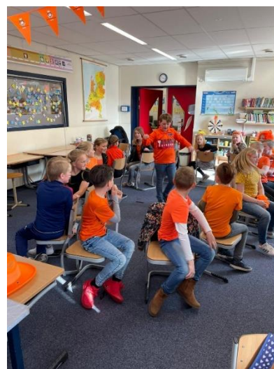
Ieder jaar weer genieten.