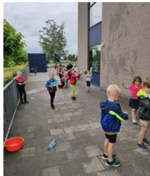
De sport- en speldag in de laatste schoolweek van 2020-2021 met onder andere waterspeltjes en twee mooi stormbanen.