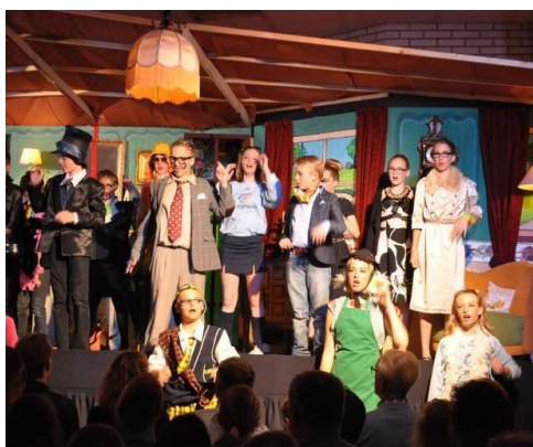
Groep 8 sluit de basisschoolperiode af met een spetterende musical in de speelzaal waar we zelf een podium en mooi decor kunnen bouwen.

Nadat we in 2018 flink onder de ondergrens zaten, is dat in 2019 flink verbeterd. Zoals gehoopt zaten we boven de ondergrens en wat ons positief verraste was het feit dat we ook net boven het landelijk gemiddelde scoorden. Ons doel was om ook in 2020 een score te halen boven de ondergrens. De Centrale Eindtoets is door de schoolsluiting i.v.m. het Covid-19 virus niet doorgegaan en we hebben dus geen score. In 2021, 2022, 2023 was er wel een Centrale Eindtoets en is de enorme inzet van deze leerlingen tijdens hun basisschoolperiode beloond met hele mooie eindtoetsresultaten. Bij alle drie de jaren een groepsgemiddelde ruim boven het landelijk gemiddelde. Natuurlijk gaan we er ook in 2024 weer voor om boven de ondergrens en boven het landelijk gemiddelde te scoren.