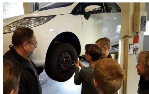
Groep 7 op bedrijfsbezoek tijdens de techniekweek.