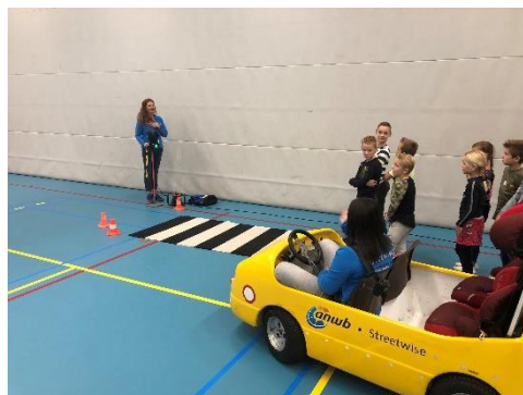
ANWB Streetwise, onderdeel toet toet auto.

Streetwise voor basisschoolleerlingen: wat leren ze? (anwb.nl)