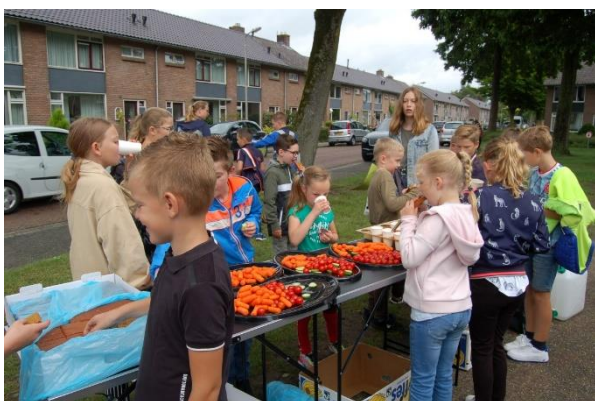
Een gezond tussendoortje tijdens de laatste schooldag, verzorgd door de ouderraad.

Door het opstellen en naleven van deze omgangscode scheppen wij een goed pedagogisch klimaat waarbinnen alle betrokkenen zich prettig en veilig voelen. Tevens bevorderen en bewaken wij de veiligheids- en welzijnsaspecten voor alle mensen die op enigerlei wijze betrokken zijn bij school.