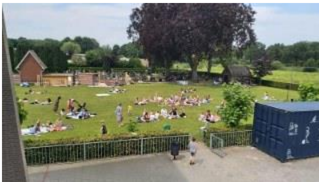
In juli 2021 sloten we het schooljaar af met een gezellige picknick op de allerlaatste schooldag.