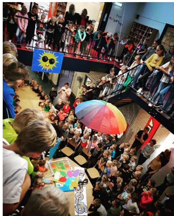
Afsluiting van de Gouden Weken aan het begin van het schooljaar. De opgestelde klassenregels worden aan elkaar gepresenteerd.

Verder is het van belang dat de school aandacht heeft voor de veiligheid in het algemeen en de sociale en de fysieke veiligheid in het bijzonder. De aandacht voor deze vormen van veiligheid vinden wij erg belangrijk en daarom hebben we hier beleid over gemaakt en opgenomen in onze manier van werken; we inventariseren en evalueren. Hoe dit gestalte krijgt binnen ons onderwijs en onze school staat beschreven in het beleidsstuk: 'Veiligheidsplan; Risico Inventarisatie en evaluatie. Plan van aanpak'. Ook dit beleidsstuk ligt ter inzage op school.