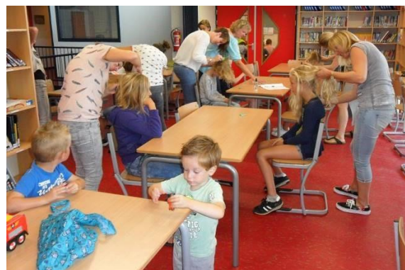
Na iedere vakantie komen er kriebelmoeders om te controleren op hoofdluis. Top die hulp!