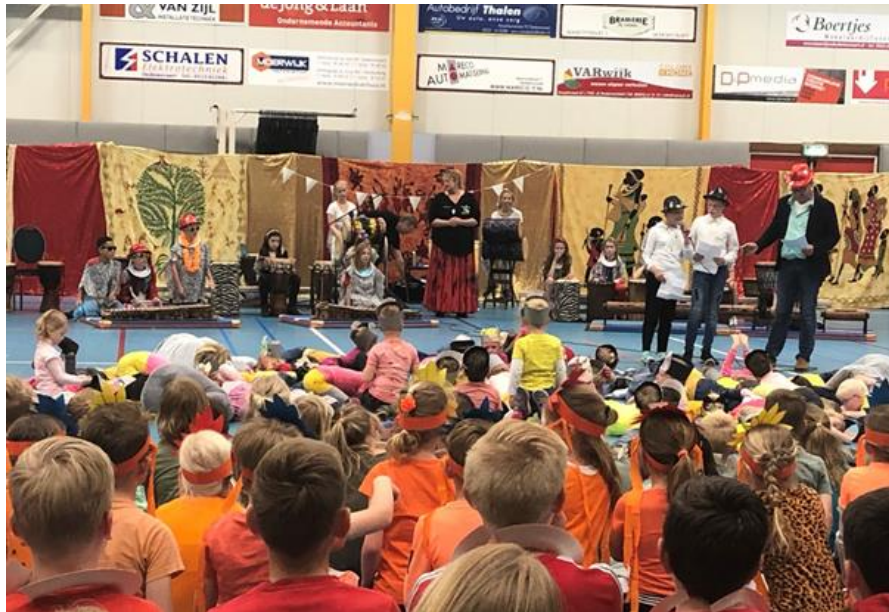
Iedere twee jaar heeft De Langewieke een grote culturele dag die wordt afgesloten met een voorstelling. In 2019 hadden we de een super mooie Drum4fun dag met een uitvoering in Sporthal de Citadel voor alle vaders en moeders.