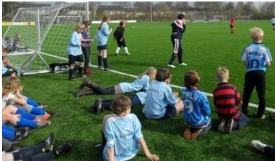
Teambuilding tijdens het schoolvoetbaltoernooi. We nemen ook deel aan het schoolkorfbaltoernooi.

Tijdens de gymlessen dragen de kinderen van groep 3 t/m 8 een sportshirt met een sportbroekje of een gypakje. Alle kinderen dragen gymschoenen. Na de les willen we dat kinderen zich even oprispen (niet douchen). De kinderen van groep 1 en 2 hebben alleen gymschoenen nodig. Zij blijven op school en gymmen in ondergoed.