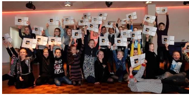
Groep 5 krijgt ieder jaar danslessen en die cursus wordt afgesloten met afdansen en een mooi diploma.