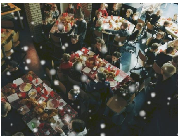
De ouderraad zorgt ieder jaar weer voor een perfect verzorgde kerstmaaltijd.

Uw vragen, ideeën en wensen zijn altijd welkom. Hiervoor kunt u altijd contact opnemen met een van de leden van de ouderraad. Voor de samenstelling van de ouderraad verwijzen we u naar het informatieboekje.