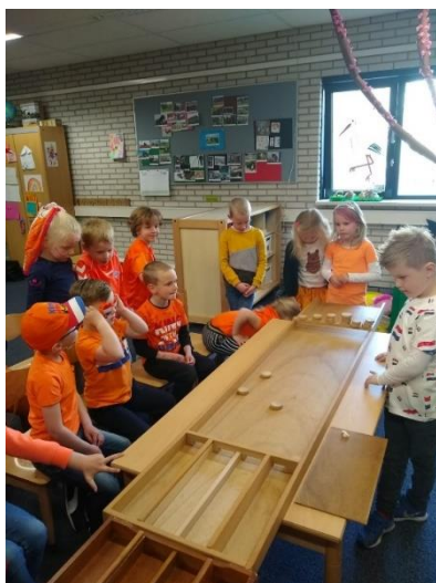
Gezelligheid tijdens de koningsspelen in april.

De school volgt de richtlijnen van het medisch protocol voor scholen van het schoolbestuur SKOT. Indien nodig kan u gevraagd worden om een verklaring in te vullen en te ondertekenen in verband met de medische handelwijze die voor uw kind gevolgd moet worden. Uitgangspunt is dat medische handelingen die onder de wet BIG vallen, niet worden verricht door leraren of andere professionals van de school.