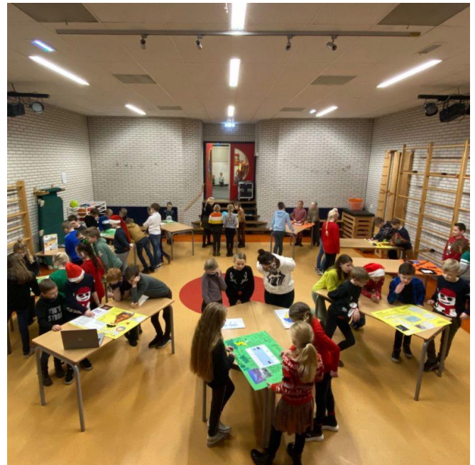
De eindpresentatie van het thema 'Aardse extremen'.

De kinderen hebben vanaf groep 6 topografie door middel van het programma Topomasters. Dit is een onderdeel van Blink. In groep 6 beginnen ze met provincies, plaatsen, wateren en belangrijke gebieden in Nederland, daarna komt Europa aan bod (groep 7) en daarna ook de rest van de wereld (groep 8). Voor topografie krijgen kinderen een leerblad mee die zij thuis gaan leren.